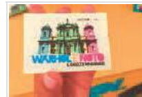
Warhol è Noto, mostra prorogata sino al 30 Ottobre