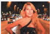
The Look of the Year, la finale mondiale a Catania