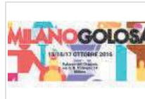
Milano Golosa, weekend tra gusto ed eccellenze