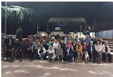
Gli anziani del...