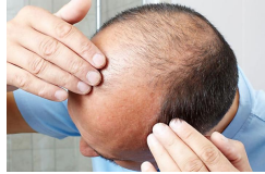
Neuer Wirkstoff gegen...