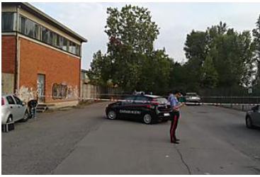
Uomo trovato morto...