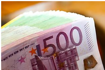
Umschulden zum Minuszins