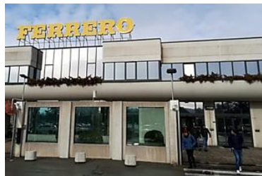
Duemila euro di premio...