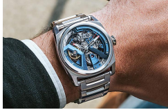
Migliaia di italiani...