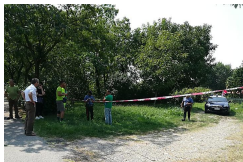
Olio bollente in...