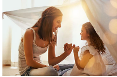
Spendenaktion: Du hast...