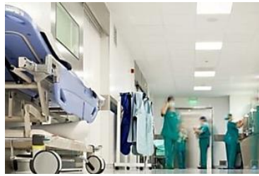
Trasfusione di sangue...

🏷️ Tag: expotraining, formazione, formazione professionale, hi-tech, lavoro