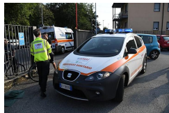
Accoltellato alla testa...