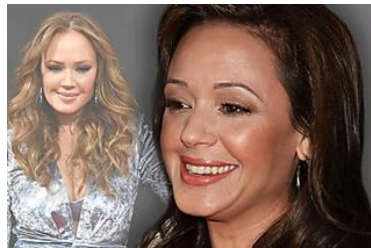
Du siehst so...