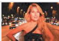
The Look of the Year, la finale mondiale a Catania