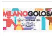
Milano Golosa, weekend tra gusto ed eccellenze