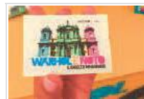
Warhol è Noto, mostra prorogata sino al 30 Ottobre